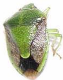
写真1 チャバネアオカメムシ成虫 (体長 10~12mm)