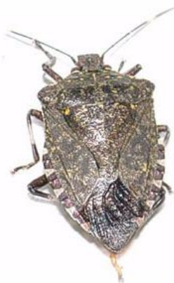
写真2 クサギカメムシ成虫 (体長 13~18mm)

問合せ先 果樹研究センター TEL 0765-22-0185 FAX 0765-22-6930 農業研究所 病理昆虫課 TEL 076-429-5249 FAX 076-429-2701